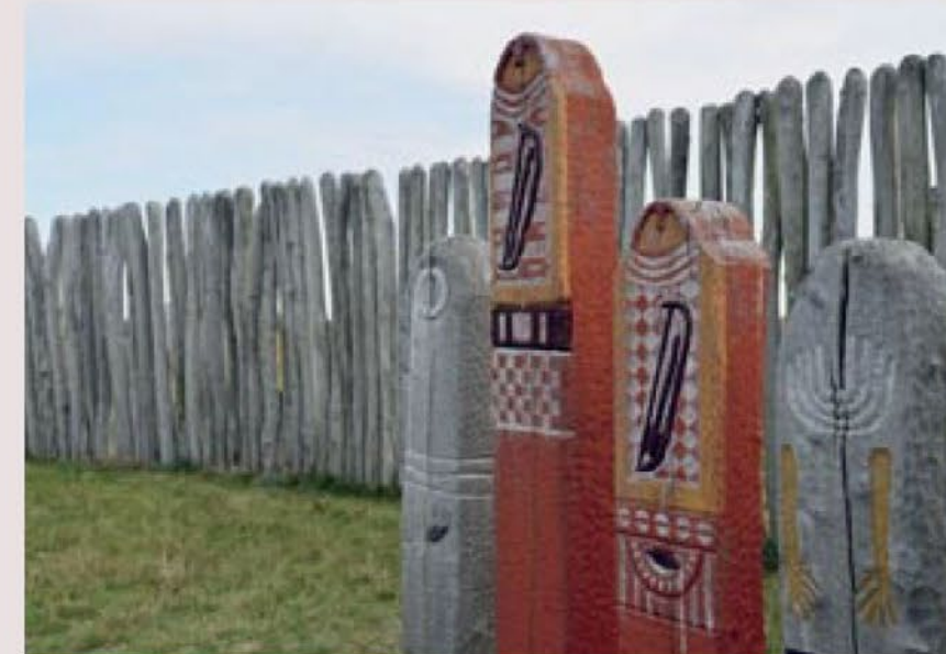
Die Kreisgrabenanlage von Pömmelte-Zackmünde besteht aus sieben Ringen.

melsscheibe von Nebra zu sehen. Der Besuch des Museums lohnt sich auf jeden Fall, denn die Sammlungen zur Vor- und Frühgeschichte sind von solch hoher Qualität, dass nicht nur Kinder und Jugendliche ins Staunen geraten. Und in der weiten Ebland-schaft liegt das Ringheiligtum Pömmelte da wie ein Wächter aus vergangener Zeit. Südlich von Magdeburg fanden Archäologen die Überreste eines mehr als 4000 Jahre alten Kultortes: die Kreisgrabenanlage von Pömmelte, die am originalen Fundort rekonstruiert wurde.