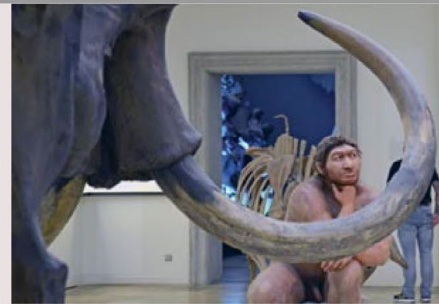
Kulturgeschichte seit der Steinzeit im Landesmuseum für Vorgeschichte in Halle.

Nur rund 35 Kilometer vom Fundort der weltberühmten Himmelscheibe von Nebra entfernt befindet sich einer der frühesten archäologischen Belege für systematische Himmelsbeobachtungen: das Sonnenobservatorium Goseck. Und, man glaubt es kaum: Diese vor 7000 Jahren entstandene Kreisgrabenanlage ist rund 2000 Jahre älter als der Steinkreis von Stonehenge. 1991 wurde sie bei einem Erkundungsflug entdeckt, es begannen die ersten Ausgrabungen der Anlage, und bereits 2005 war sie vollständig rekonstruiert. Der perfekte Sternensucher-Ort ist die Arche Nebra mit einem großen Besu-